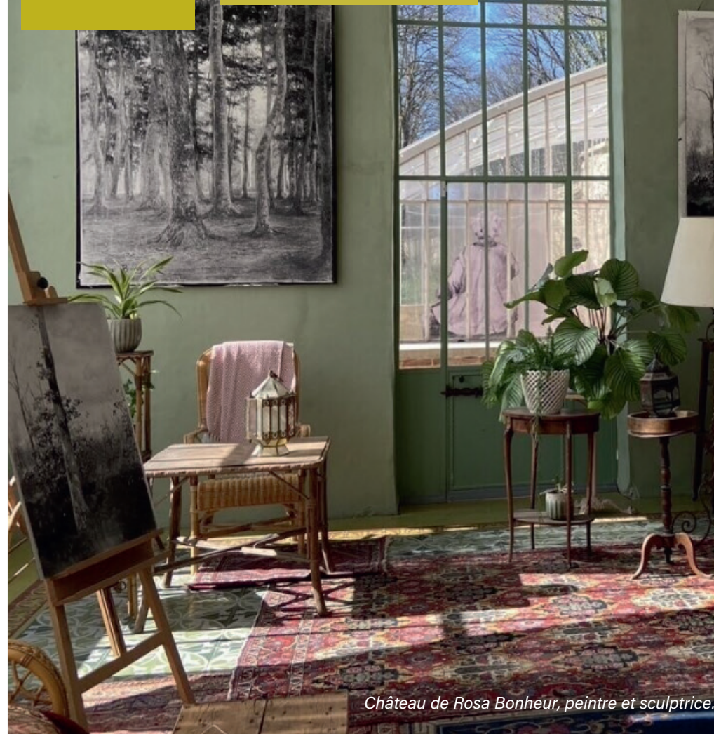
Château de Rosa Bonheur, peintre et sculptrice.

Programme des sorties de janvier à juin 2026