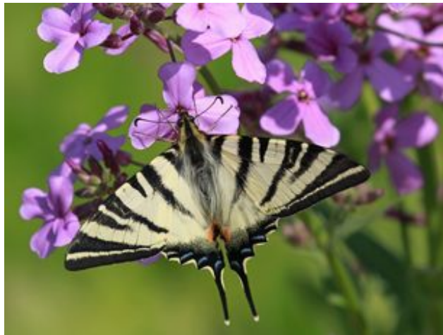
^ Le Flambé (protégé)