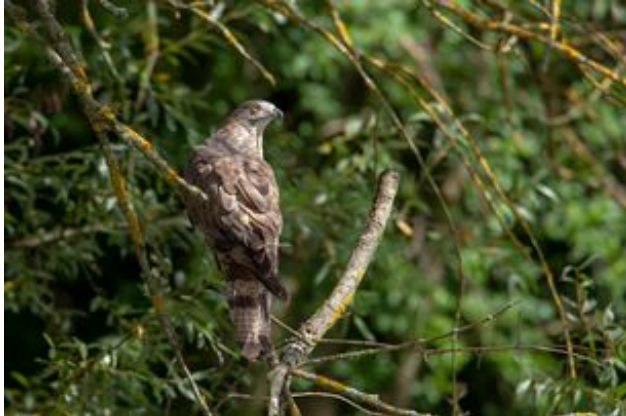
^ La Bondrée apivore