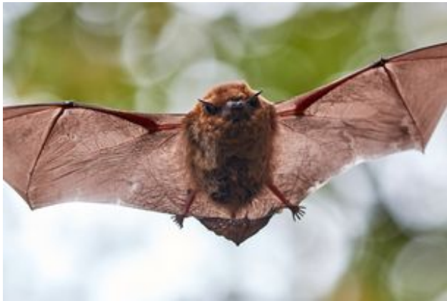
^ La pipistrelle commune