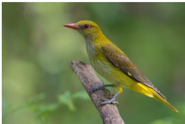
^ Le Lorient d'Europe