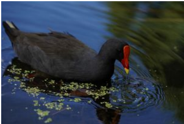
^ Les poules d'eau

En coeur de ville, le Lac de Sévigné abrite un refuge ornithologique créé pour les espèces pérennes et de passage