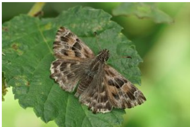
^ L'Hespérie de l'Alcé (protégé)