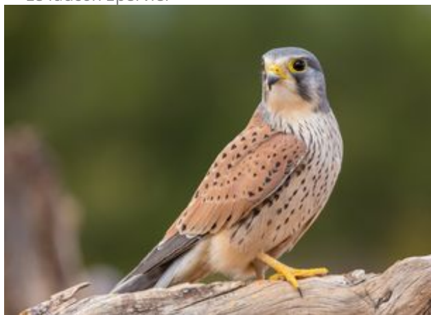
^ Le faucon Crécerelle