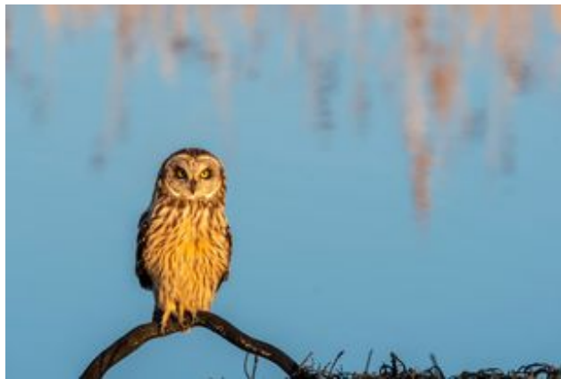
^ Le Hiboux des marais