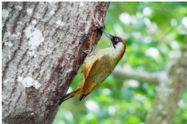
^ Le Pic vert