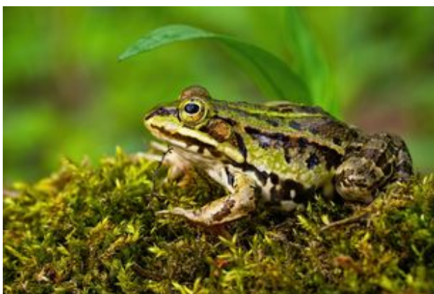
^ La grenouille verte