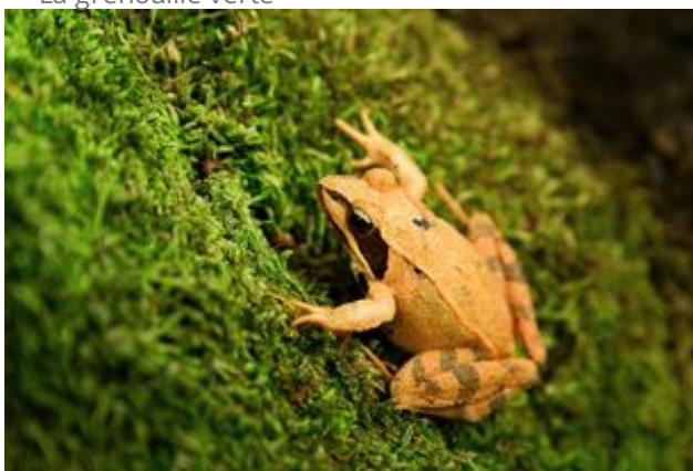
^ La grenouille agile