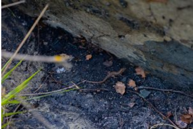
^ Le lézard

En coeur de ville, le Lac de Sévigné abrite un refuge ornithologique créé pour les espèces pérennes et de passage