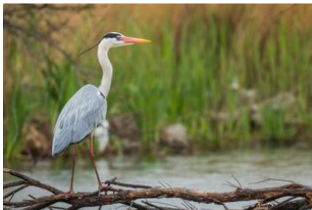
^ Les hérons cendrés