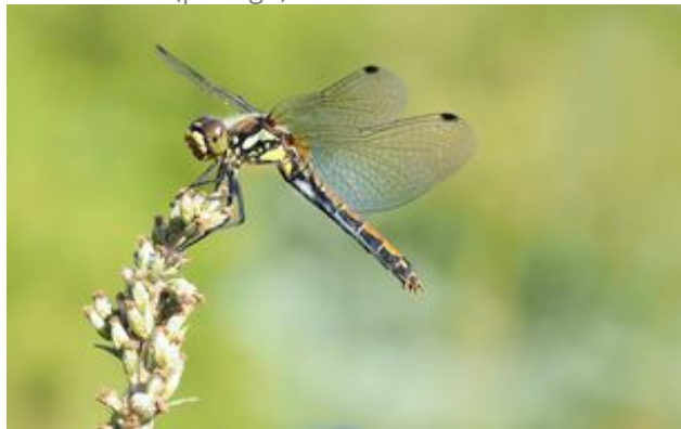
^ Le Sympétrum noir (protégé)