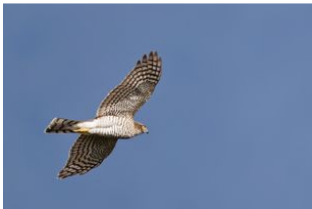
^ Le faucon Épervier