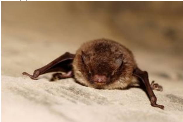
^ Le murin à moustache