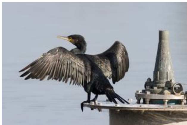
^ Les cormorans