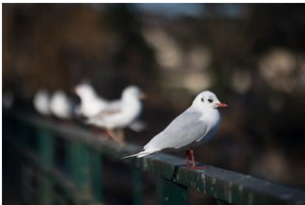
^ Les mouettes