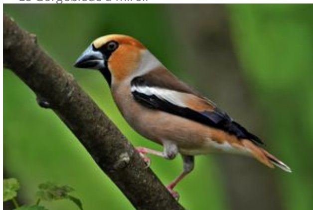
^ Le Gros bec casse noyaux