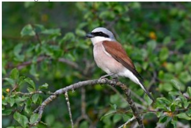
^ La Pie grièche écorcheur