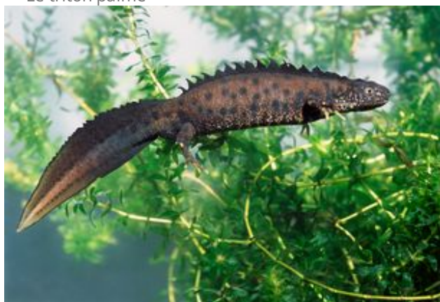
^ Le triton crêté