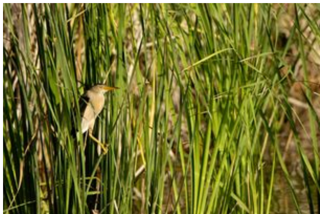
^ Le Blongios nain