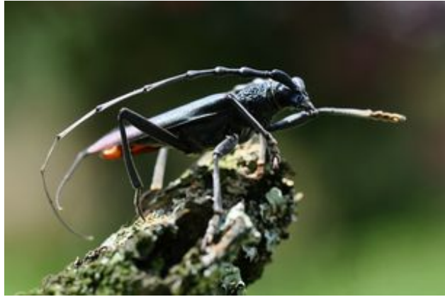
^ Le grand Capricorne