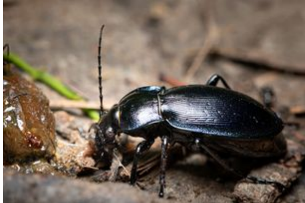
^ Le Synuque des bois (protégé)