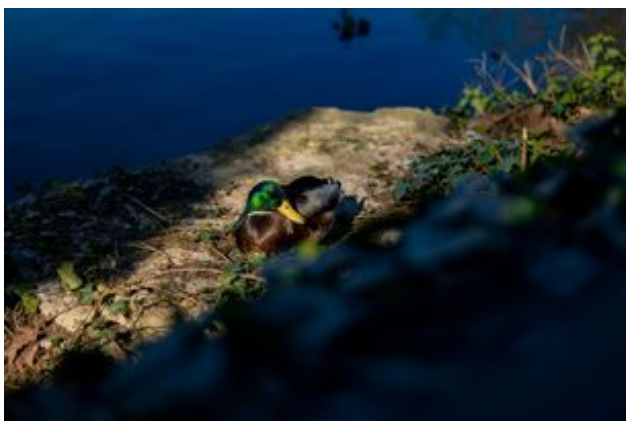
^ Les canards colverts