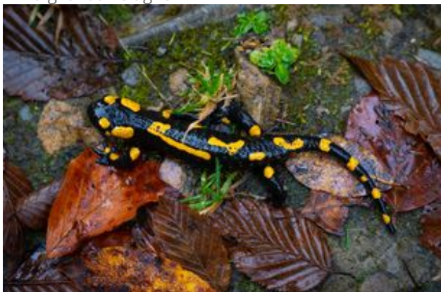
^ La salamandre tachetée