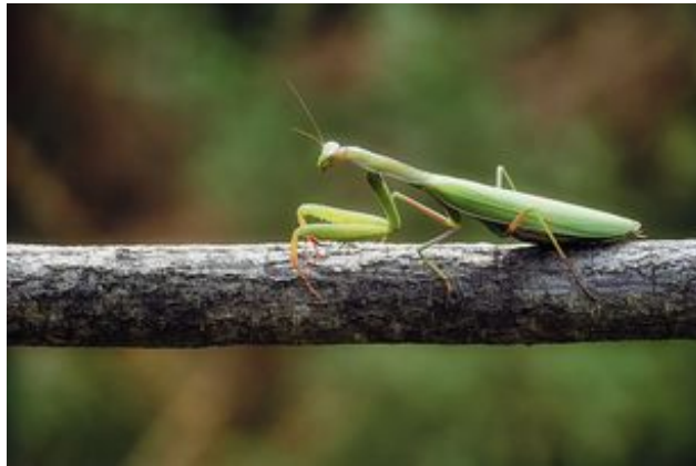
^ La mante religieuse (protégée)

Des reptiles présents dans certaines zones naturelles (comme la mare Barois)