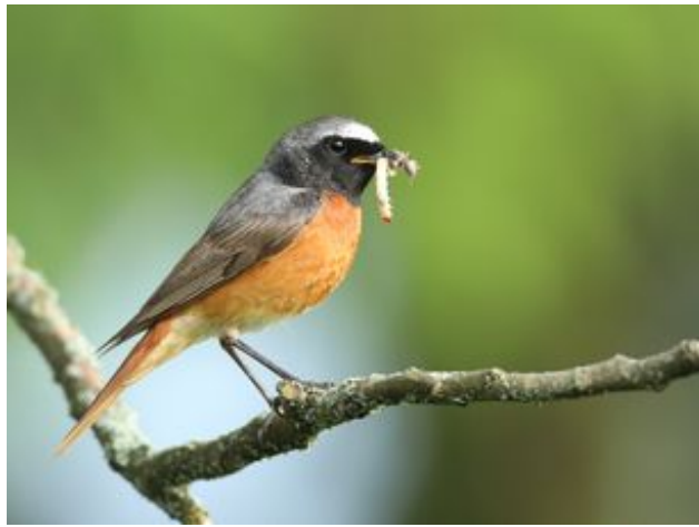
^ Le Rouge-queue à front blanc