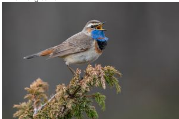
^ Le Gorgebleue à miroir