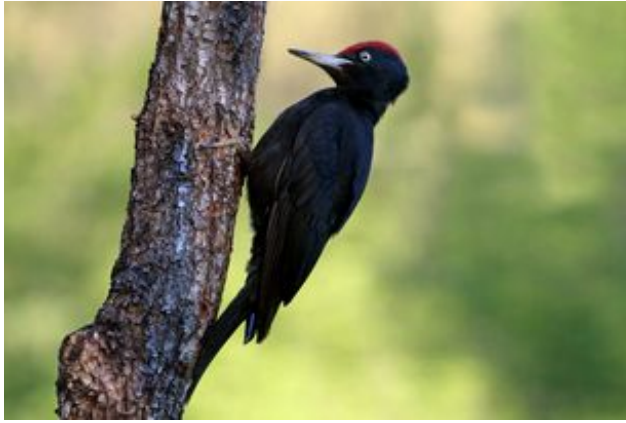
^ Le Pic noir