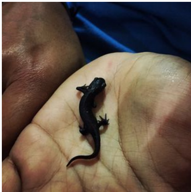
^ Le triton palmé