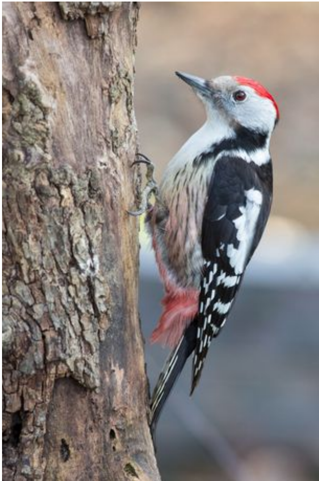
^ Le Pic mar