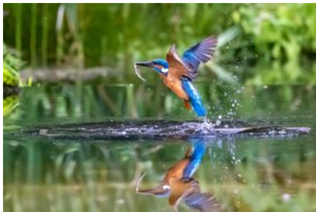
^ Le Martin-pêcheur