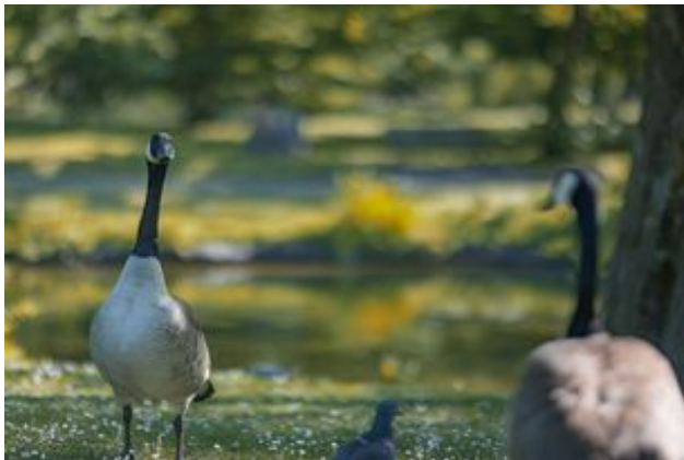
^ Les oies de Bernaches