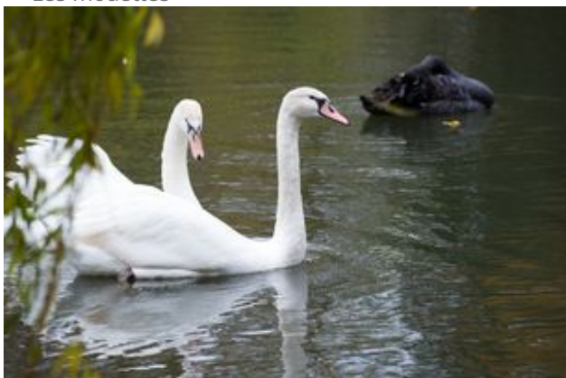
^ Les cygnes